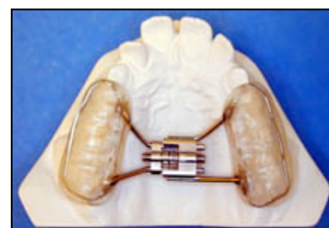
Modèle avec recouvrement acrylique des dents