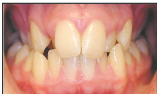
Maxillaire supérieur étroit