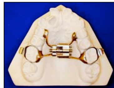
Modèle avec bagues sur les dents

Au centre du palais, un système de vis permet d'élargir graduellement le palais.